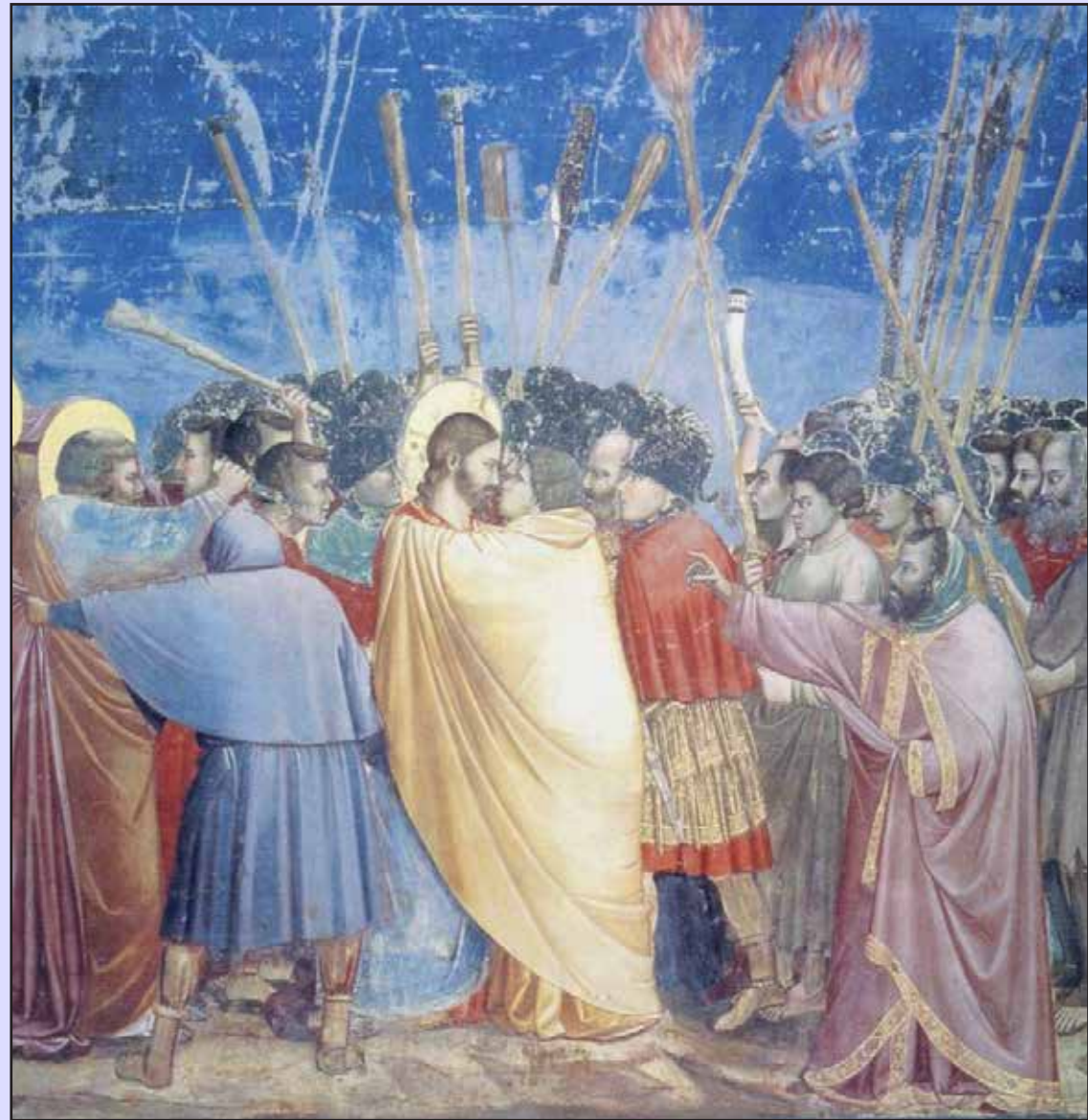
Zdrada Judasza. Fresk z cyklu ukazującego życie Jezusa, namalowany ręką włoskiego malarza renesansowego, Giotto di Bondone (1267-1337) i przeznaczony do Capella degli Scrovegni w Padwie (ok. 1305 r.).

Już pierwsze zdanie Ewangelii wiele wyjaśnia: Tajemna nauka pouczenia w którym Jezus przekazał to, co opowiedział Judaszowi Iskariocie w czasie ośmiu dni, na trzy dni zanim sprawował paschę . Nie były to więc słowa adresowane do świata, lecz do pojedynczej osoby lub małej, przygotowanej do tego grupy. Ukazują one Judasza w zupełnie innym świetle, nie odnosząc się do postaci znanej z czterech pozostałych ewangelii. Postać Judasza zostaje przeciwstawiona innym uczniom Jezusa, których imiona nie zostały w tej Ewangelii nawet wspomniane. Jezus przemawia do nich trzykrotnie i za każdym razem spotyka się z dezorientacją i niezrozumieniem. Modlą się