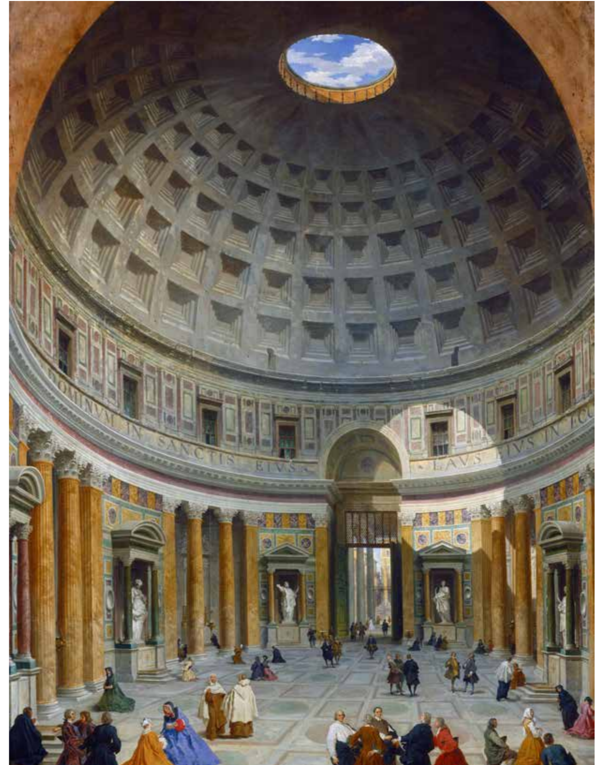
Wnętrze Panteonu w Rzymie. Giovanni Paolo Panini (1691 – 1765).

Drugie dzieło, „Eksplodująca głowa rafałowska”, ukazuje głowę świętego, która od wewnątrz wygląda dokładnie tak samo jak Panteon. Można powiedzieć, że otwór w kopule pokrywa się z miejscem ciemienia. Czyżby wskazywał drogę wnikania Światła, a więc inną świadomość niż ta, która powstaje na podstawie doświadczeń zmysłowych? Czy Artysta właśnie takie treści chciał wyrazić? Sam Dali stwierdził po prostu: