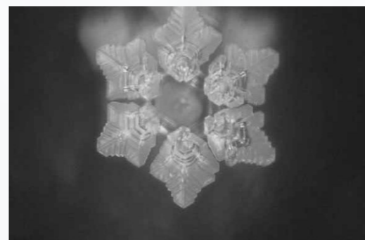
Zdjęcia kryształów wody Masaru Emoto. Po lewej woda z buteleczki podpisanej słowami „Miłość i Wdzięczność”, po prawej woda po „obejrzeniu” zdjęcia kwiatu wiśni.