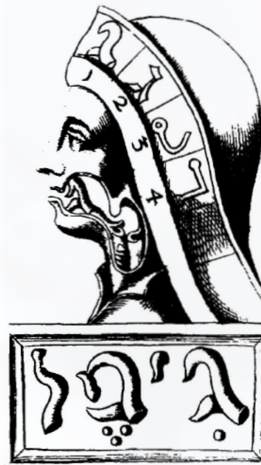
Krótki opis prawdziwego hebrajskiego ABC, F. M. van Helmont, 1607 r.

Zdolność rozumienia słów jest wspaniałym zjawiskiem, nie wspominając o cudzie mowy. Proces mówienia przebiega w sposób następujący: człowiek pobiera z pola oddechu do swojego systemu substancję astralną. W czasie wypowiedzenia słów ta indywidualnie zabarwiona substancja astralna wysyłana jest jako