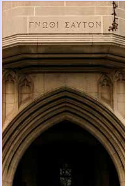
Gnothi seauton, czyli Poznaj siebie

wgląd w Boga, naturę i w samą siebie. W ten sposób człowiek mógłby zgłębić istotę potężnej matrycy, pierwotnej idei znajdującej się u podstaw stworzenia i jego istnienia, w równej mierze stałby się wtedy