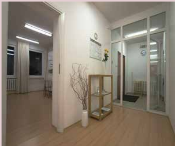
Centrum w Koszalinie, ul. Andersa 26