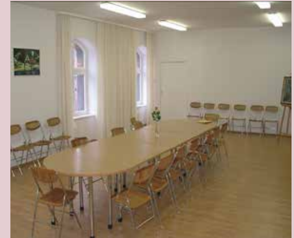
Centrum w Warszawie, ul. Inżynierska 3/5