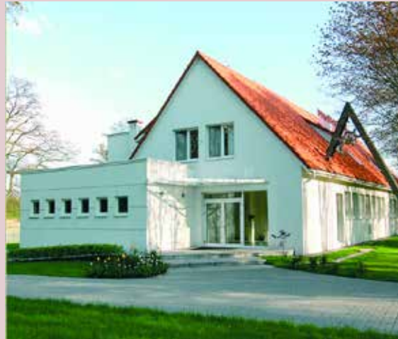
Ośrodek konferencyjny w Wieluniu