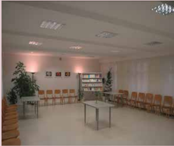
Centrum w Katowicach, ul. Francuska 33 A