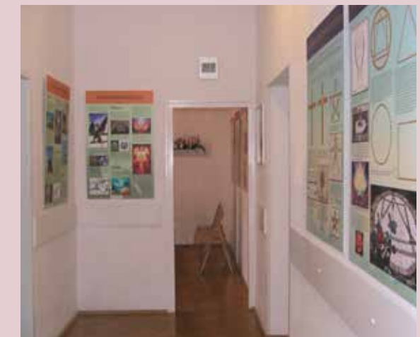
Centrum we Wrocławiu, ul. Wandy 7/11